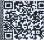
户政业务智能咨询 预约平台